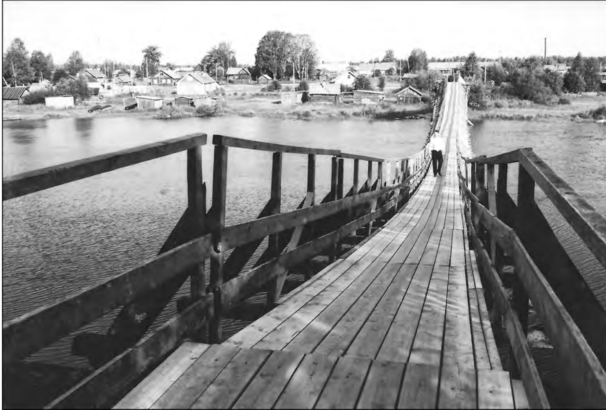
Jyskjärven mahtavat riippusillat.