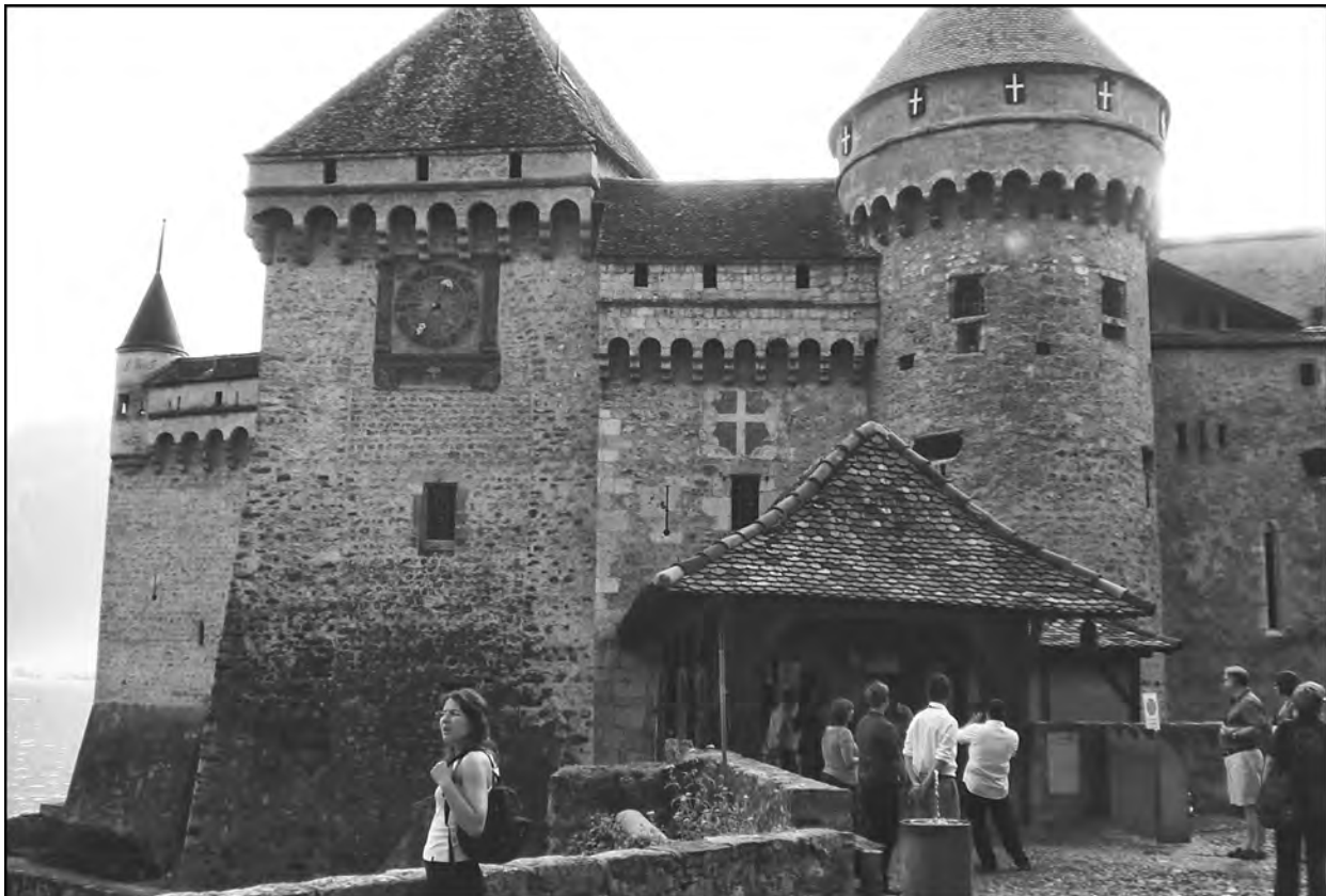
Chillonin linnaa rakentaessa taisi sähköherkkyys olla vielä tuntematon vaiva.